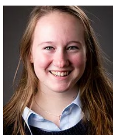
Charlotte Cohen Website Stroming: GWZ